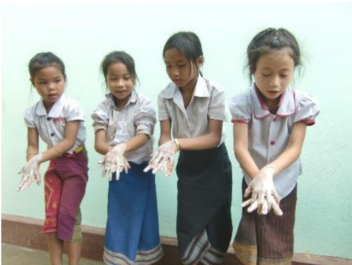
・指の間もきれいに洗う児童たち