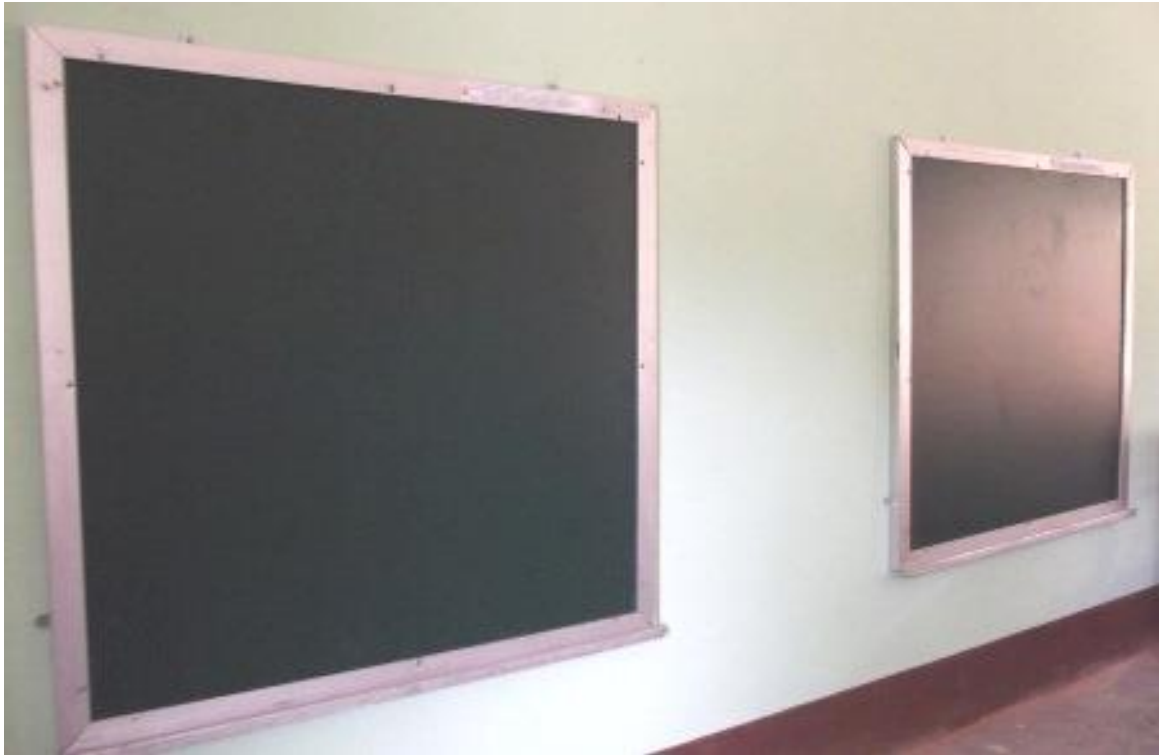
・複式学級用に設置された黒板