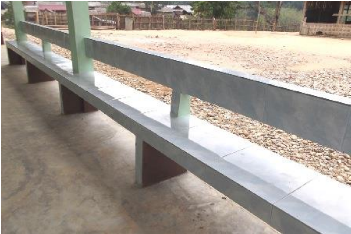
・教室前廊下に設置されたベンチ