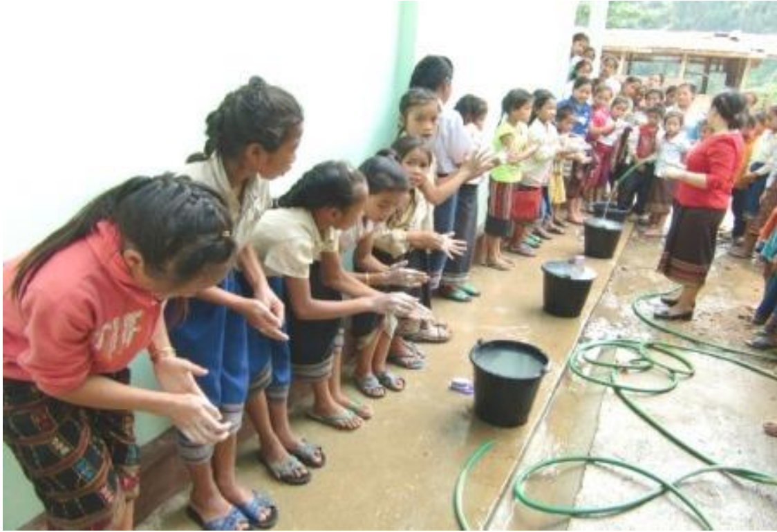
・衛生教育の研修会の後に、石鹼で手の洗い方を学んでいる児童たち