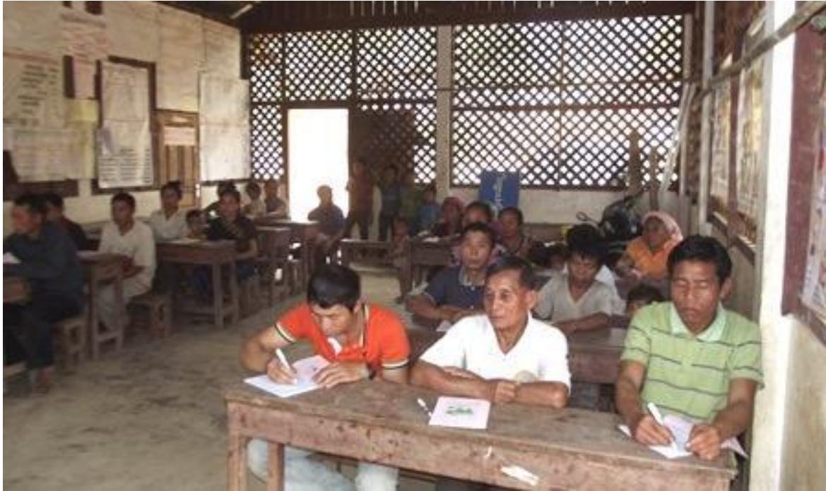
・学校教育の重要性を知るための研修会に参加した住民