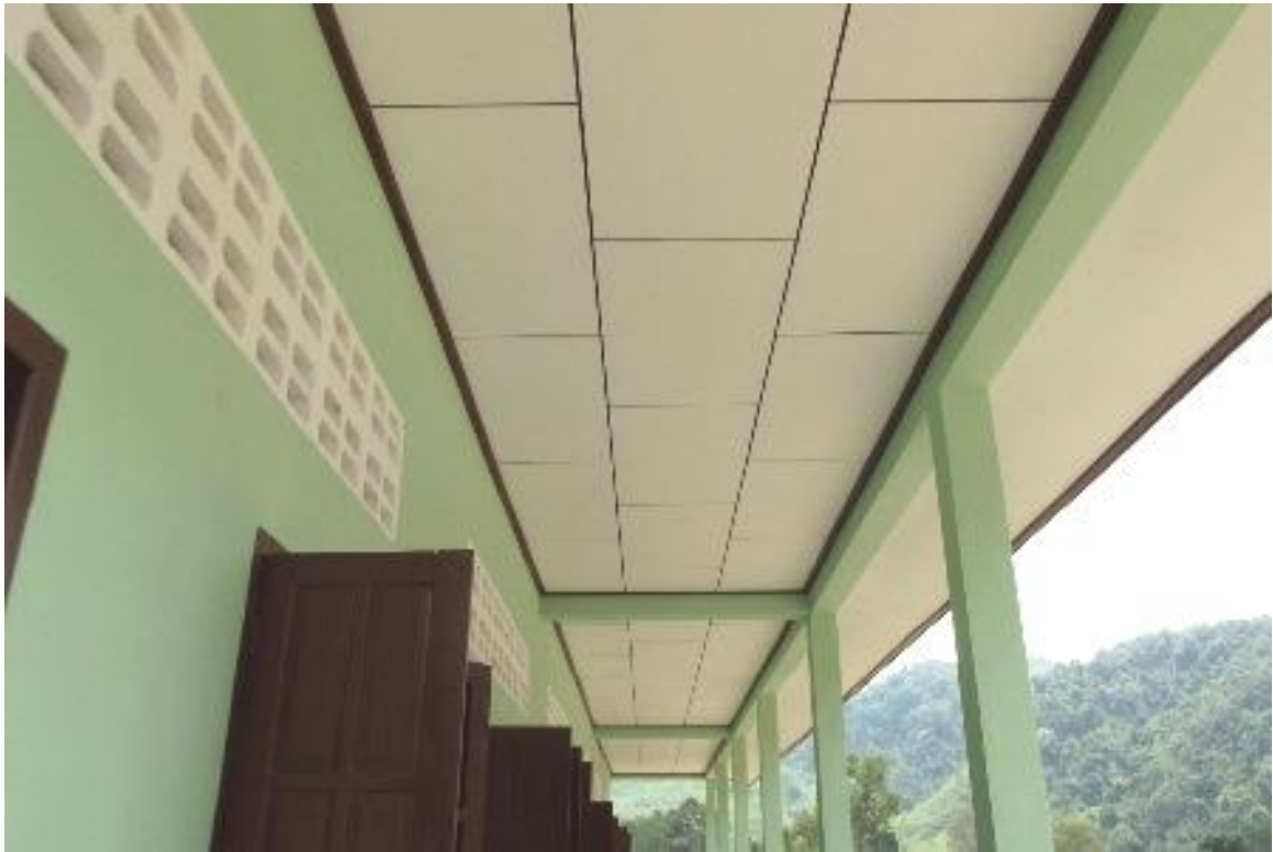
・教室前通路の天井