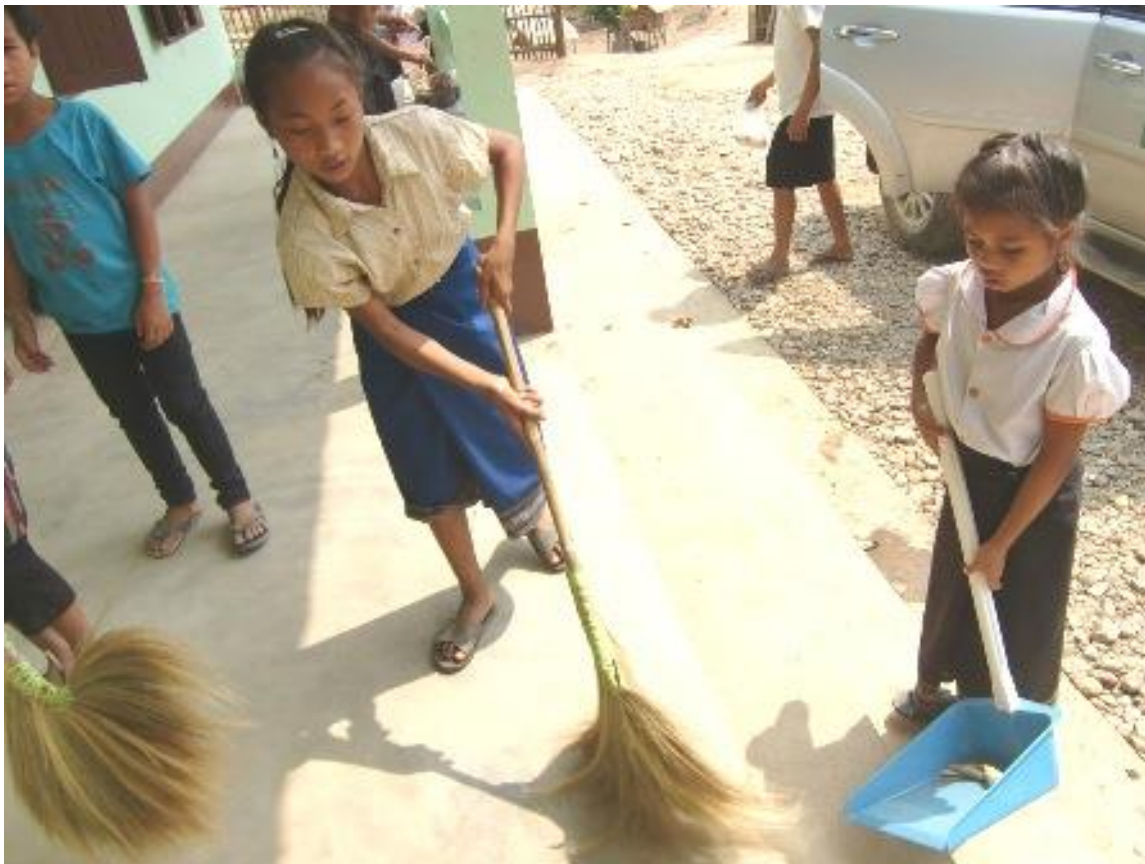
・校舎の掃除をする児童たち