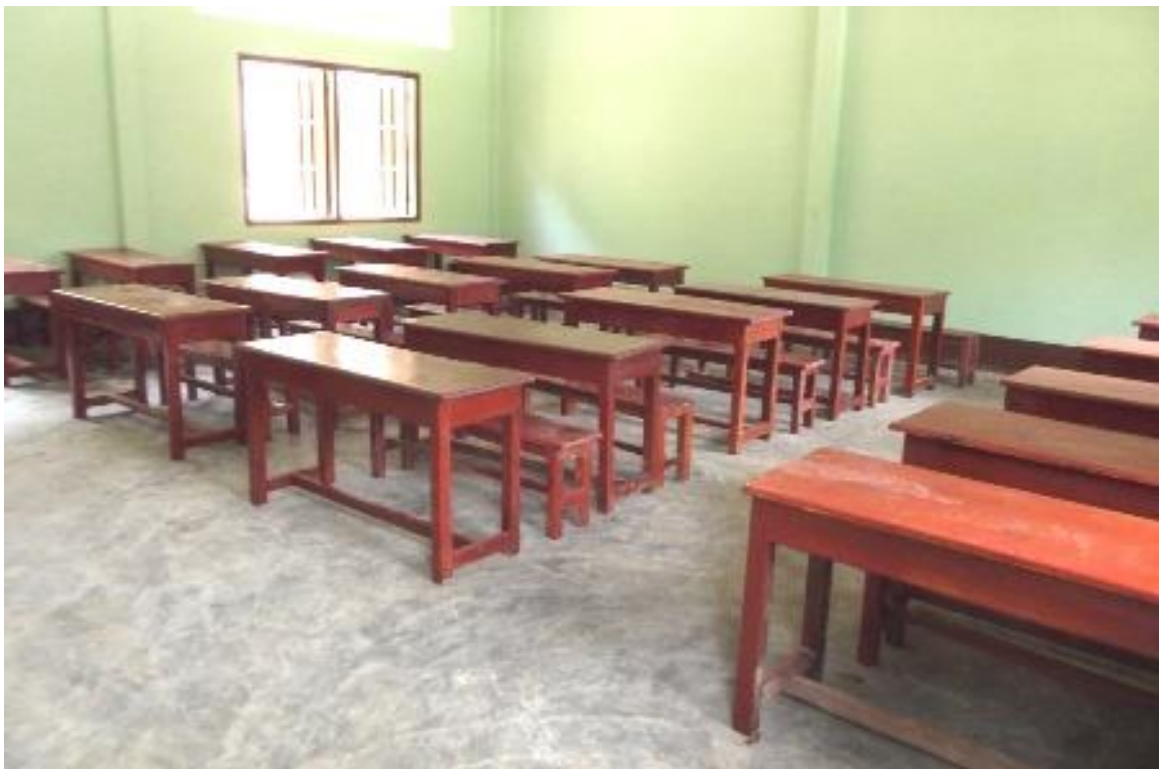
・児童用の椅子と机